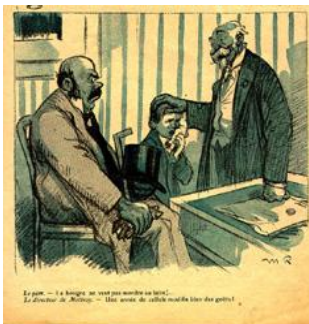
L'Assiette au Beurre, 13 Février 1909.

Ce sont des hommes considérables, chargés d'ans, d'honneurs et de dignités. Ce sont des hauts magistrats, des membres notoires d'une académie vertueuse entre toutes - puisqu'elle s'appelle Académie des Sciences Morales, - des législateurs d'une essence supérieure... Oui, ce sont des hommes considérables que Messieurs les Administrateurs de la Maison Paternelle de Mettray ; mais ce sont aussi des bourreaux amateurs, des criminels de droit commun sur lesquels la main de la Justice doit s'abattre avec d'autant moins de ménagements qu'ils furent toujours impitoyables avec les autres.